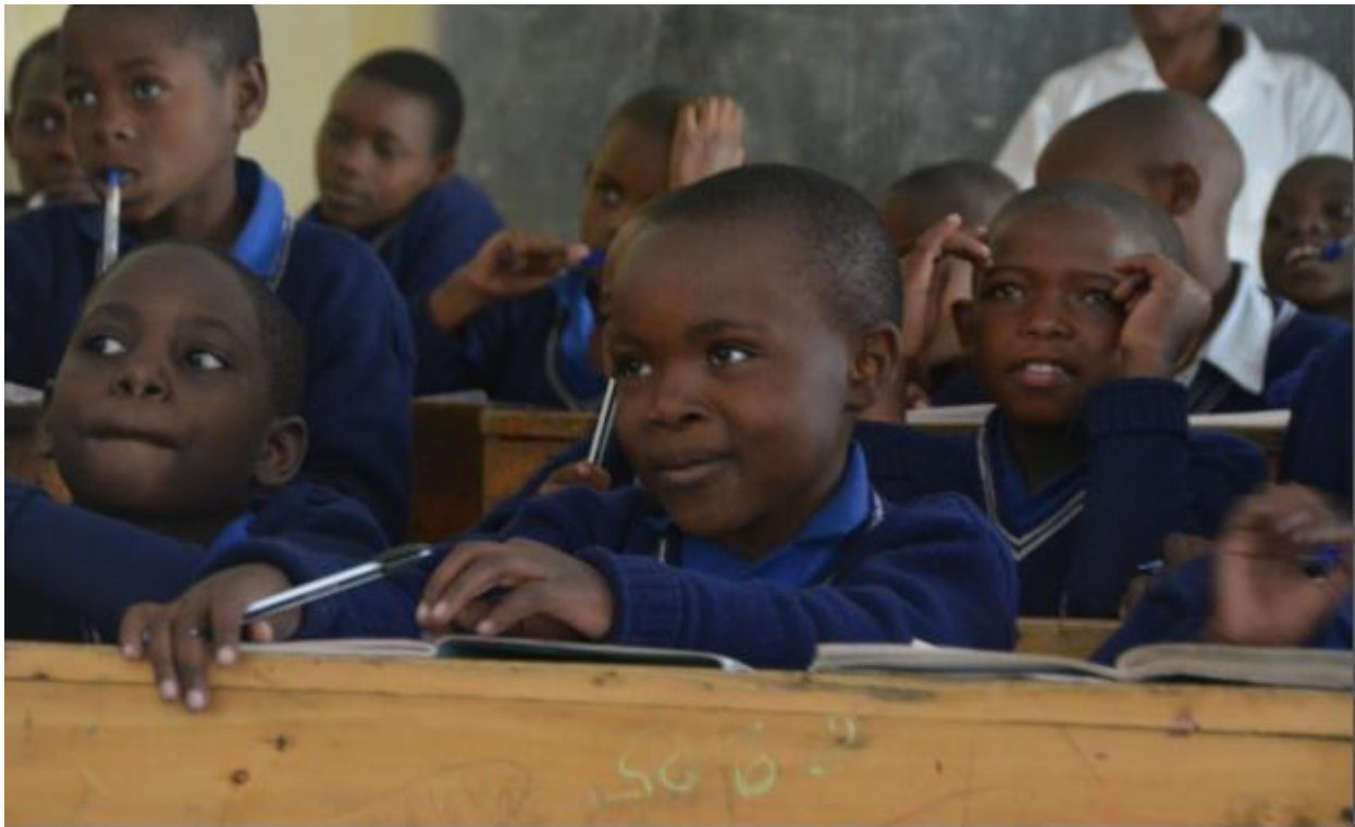
Foto: dove kinderen in de schoolbanken van de Nyabihu school for the deaf in Rwanda

De Fynn Foundation zet zich in om: (1) ouders van dove kinderen te helpen om gebarentaal te leren en (2) dove kinderen naar school te laten gaan. Zo krijgen deze kinderen écht de kans op een toekomst zonder armoede.