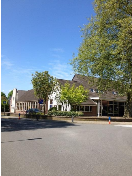
Nu staat de auto er nog, straks soms de Meeuwenberg fiets. ☺