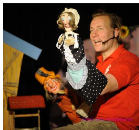
Theater voor groep 1 t/m 8 Woensdagmorgen 27 februari