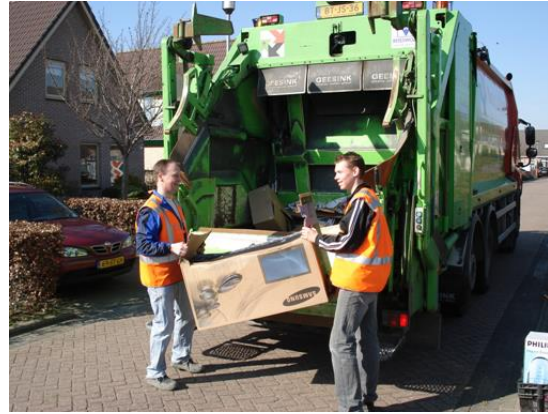
In 2018 € 1.527,-- bij elkaar geraapt! Hulde aan de beladers van De Meeuwenberg!

Wat we met het geld gaan doen? Er gaat een deel naar het nieuwe speeltoestel, we kopen nieuwe leesboeken(oud papier naar nieuw papier) en we besteden het aan culturele uitstapjes. Natuurlijk op zo'n manier dat alle kinderen hiervan profiteren.