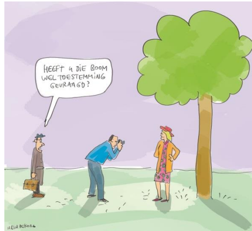
De tamme kastanje op ons achterplein heeft er geen problemen mee.

Twee groepen hebben in het afgelopen jaar een pilot gedaan met Klasbord. De ouders hebben unaniem positief gereageerd bij de evaluatie. Toch moeten wij u jaarlijks om toestemming vragen om hiermee door te gaan.