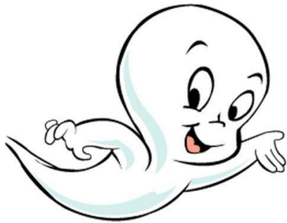
Casper het spookje