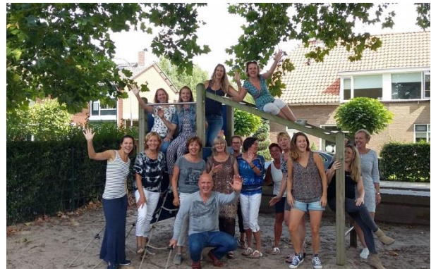
We hebben er zin in!